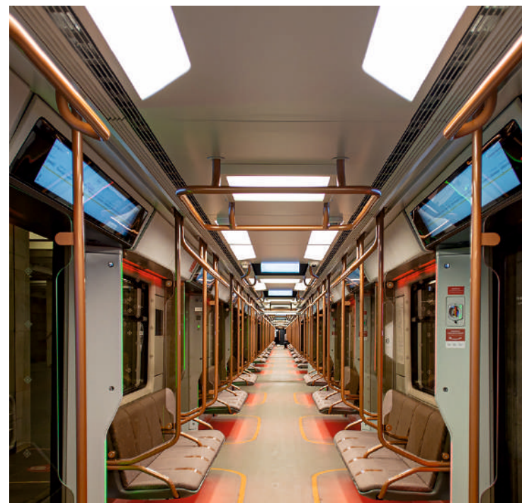
Пример внутреннего освещения вагона метро