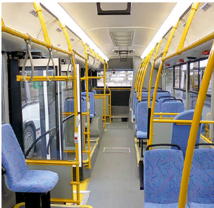
Пример внутреннего освещения автобуса «МАЗ»