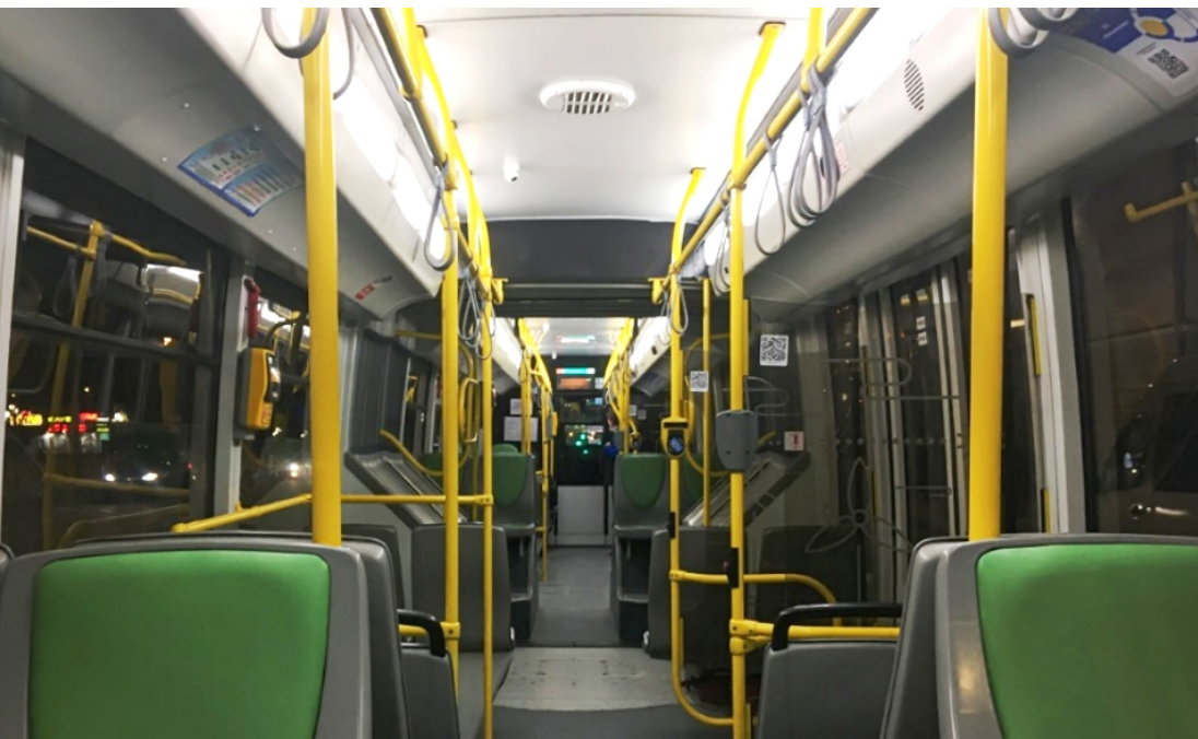
Пример внутреннего освещения троллейбуса