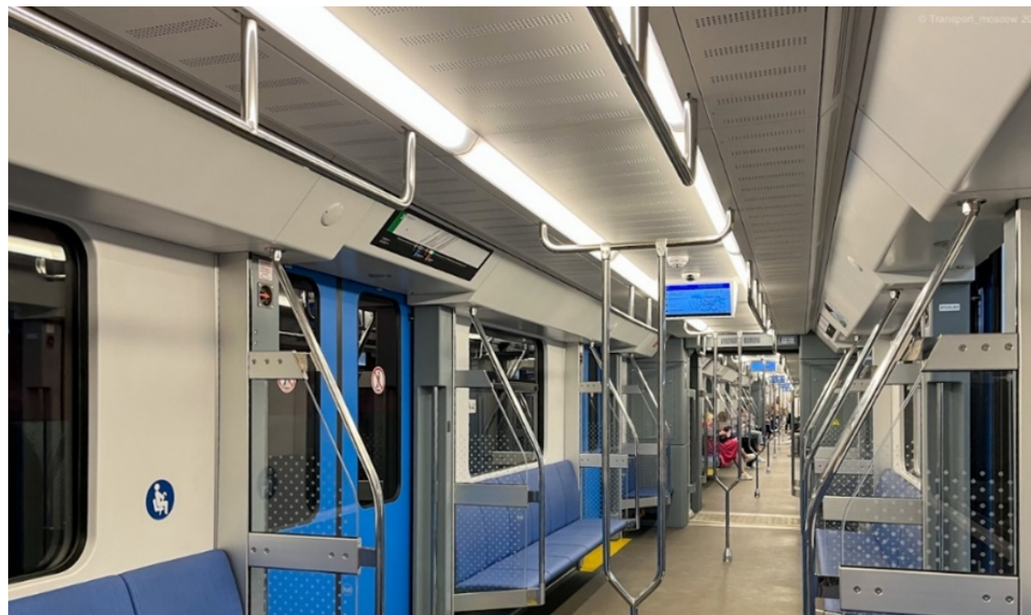
Пример внутреннего освещения вагона Stadler